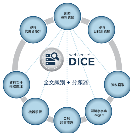
Websense Data Endpoint 使用 DICE，以相關內容感知的方式分類資料

Websense DICE 結合多種分類器和即時的使用者、資料和目標相關內容感知能力，可對整個 TRITON 架構提供非常準確且一致的資料外洩防護能力。DICE 支援三種資料分類：描述式、註冊式和學習式。描述式資料包括正規表示式、字典和自然語言分類器，有包含超過 1700 個政策和範本可供使用；註冊式資料包含文件及資料庫指紋資訊，同時也可以經過壓縮並保存在端點，以供端點電腦於網路離線防護之用；學習式資料是進階的機器學習技術，利用演算法分析少量的資料，以填補描述式和註冊式資料間的缺口，提供更高的準確性和效率。資料竊取防護功能包含對圖片文字進行 OCR、偵測客製化加密檔案和密碼檔案竊取、偵測滴漏式資料外洩和地理位置感知能力。DICE 可用於搜尋作業、闖道和端點，並從單一主控台進行管理。